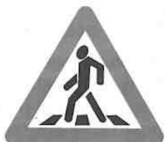
Предупреждающий знак 1.22 «Пешеходный переход»