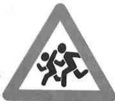
Предупреждающий знак 1.23 «Дети»

Этот знак — для водителей. Он вовсе не разрешает переходить проезжую часть в том месте, где он установлен. А лишь информирует водителя о том, что на дороге могут неожиданно появиться дети, так как впереди школа, детский сад или другая организация.